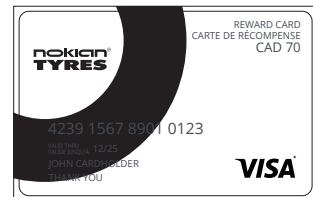
Illustration de la carte prépayée à titre d'exemple seulement. La carte reçue peut être différente de celle représentée ici.

Pour vérifier le statut de votre réclamation, visitez : www.nokiantyresrebates.ca